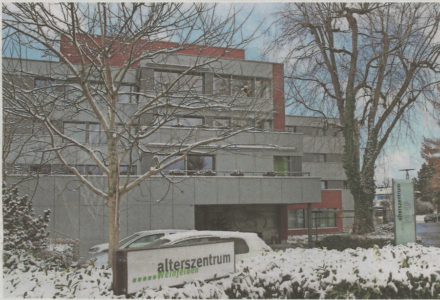
Alterszentrum Weinfelden: Die Erneuerungsarbeiten im Haus A, die im 2018 und 2019 stattfinden werden, haben auch Auswirkungen auf die Taxordnung der sanierten Zimmer.

Beim Umbau werden 24 Zimmer der Bewohnerinnen und Bewohner mit einer neuen WC- und Duscheinheit ausgestattet. Erneuert werden zudem die Einbauschränke, Türen, Bodenbeläge und technischen Installationen. «Die Zimmergrößen bleiben allerdings unverändert. Auch werden wir weiterhin Einer-, Zweier- und Dreierzimmer anbieten», sagt Preisung. Durch das neue Fluchttreppenhaus und den Einsatz von Schiebetüren könnten die öffentlichen Räume besser genutzt werden, ergänzt er. Zudem werde ein Aufenthaltsraum vergrössert, zwei weitere neu gestaltet.