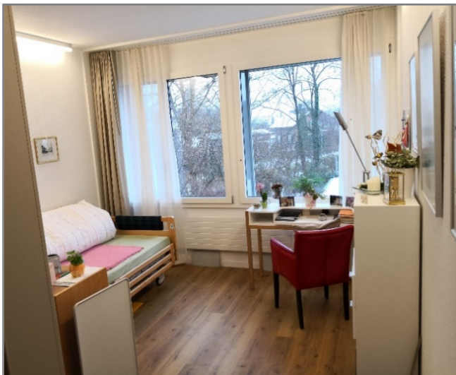
1er-Zimmer mit WC / Dusche